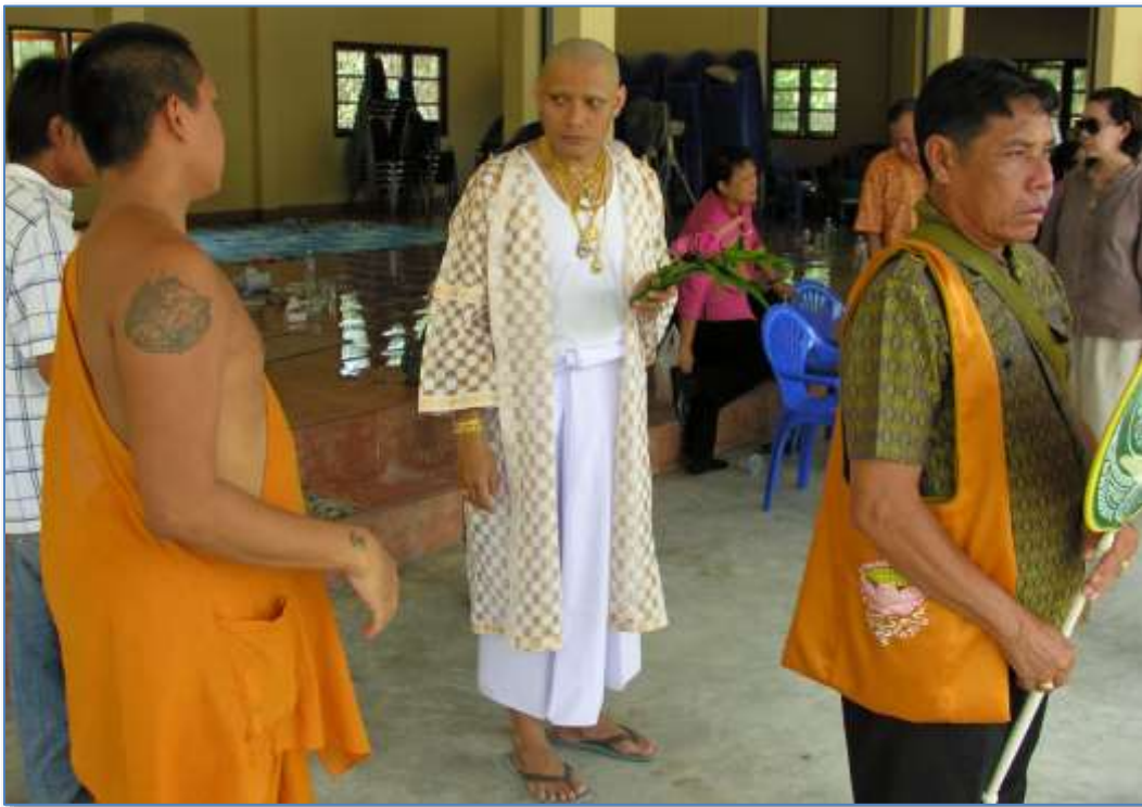
Ordinationszeremonie: Farben sind in Thailand mit Bedeutung und Symbolik aufgeladen

Thailand zählt die Jahre nicht nach dem christlichen, sondern nach einem eigenen buddhistischen Kalender. Danach beginnt die Zeitrechnung mit dem angenommenen Eintritt Buddhas ins Nibbana im Jahre 543 v.Chr. Das Jahr 2000 christlicher Zeitrechnung entspricht dem thailändischen Jahr 2543, das thailändische Jahr 2564 dem westlichen Jahr 2021.