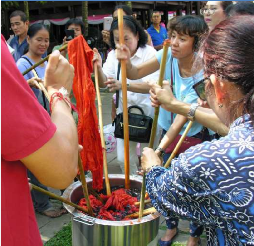
Färbezeremonie anlässlich eines thailändischen Tempelfestes

Die Tagesfarbe soll sich angeblich nach der Farbe einer Gottheit und deren Planet richten. Die Farbwahl nach Wochentag veränderte sich im Lauf der Zeit und war besonders im 19. und zu Anfang des 20. Jahrhunderts beliebt. Sie findet noch heute bei traditionsbewussten Frauen Beachtung. Am Mittwoch sollte man sich übrigens keinesfalls die Haare schneiden lassen, weil es Unglück bringen würde. Welch eine Tragödie, wenn die Haare nach dem Färben am Mittwoch plötzlich grün wären...!